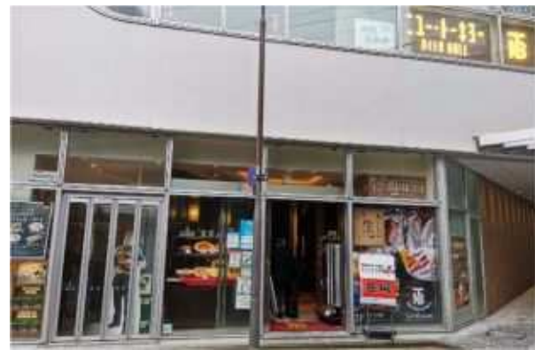
会場 ニュートーキョー数寄屋橋本店