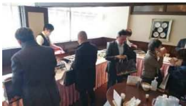
出展商品を使ったレストラン考案フェア