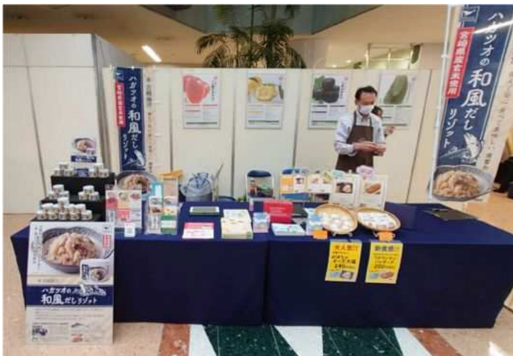
「園芸の祭典」への出展（R4.3.20～21）

内 容 かぼちゃチーズ大福、フロランタンバルダーヌ、グラニータ及び新商品缶詰の販売